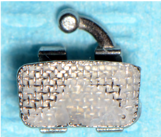
Рис. 2. Ортодонтический замок после испытания прочности Fig. 2. Orthodontic bracket after strength test

На вестибулярную поверхность зубов II группы на 30 секунд наносили гель-кондиционер с 37%-ной ортофосфорной кислотой. Затем гель смывали водой, поверхность тщательно просушивали, а на кондиционированную поверхность зубов наносили праймер Ortho solo и раздували его воздухом в течение 5–10 секунд, при этом, в соответствии с инструкцией производителя, фотополимеризацию праймера не проводили. Поверхность брекетов, как и в I группе, обезжиривали жидкостью Ангидрин,