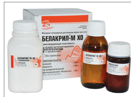
Рис. 1. Самотвердеющая пластмасса на основе метилметакрилата БЕЛАКРИЛ-М ХО

Как и в случае с пластмассами холодного отверждения, материалы компании "ВладМиВа" отличаются тем, что в качестве основного компонента жидкости в них используется