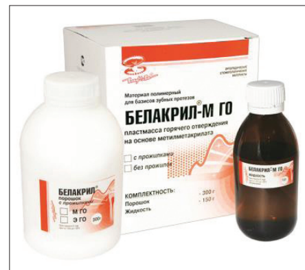
Рис. 2. Пластмасса горячего отверждения на основе метилметакрилата БЕЛАКРИЛ-М ГО